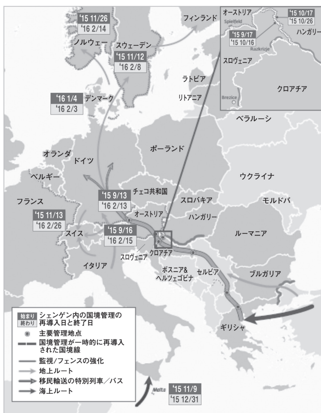
図7 2015年9月以降のシェンゲン加盟国間の域内国境における国境管理再導入

出所：Frontex (2016a) Annual Risk Analysis 2016 , p.33. ただし図の位置を一部修正している。